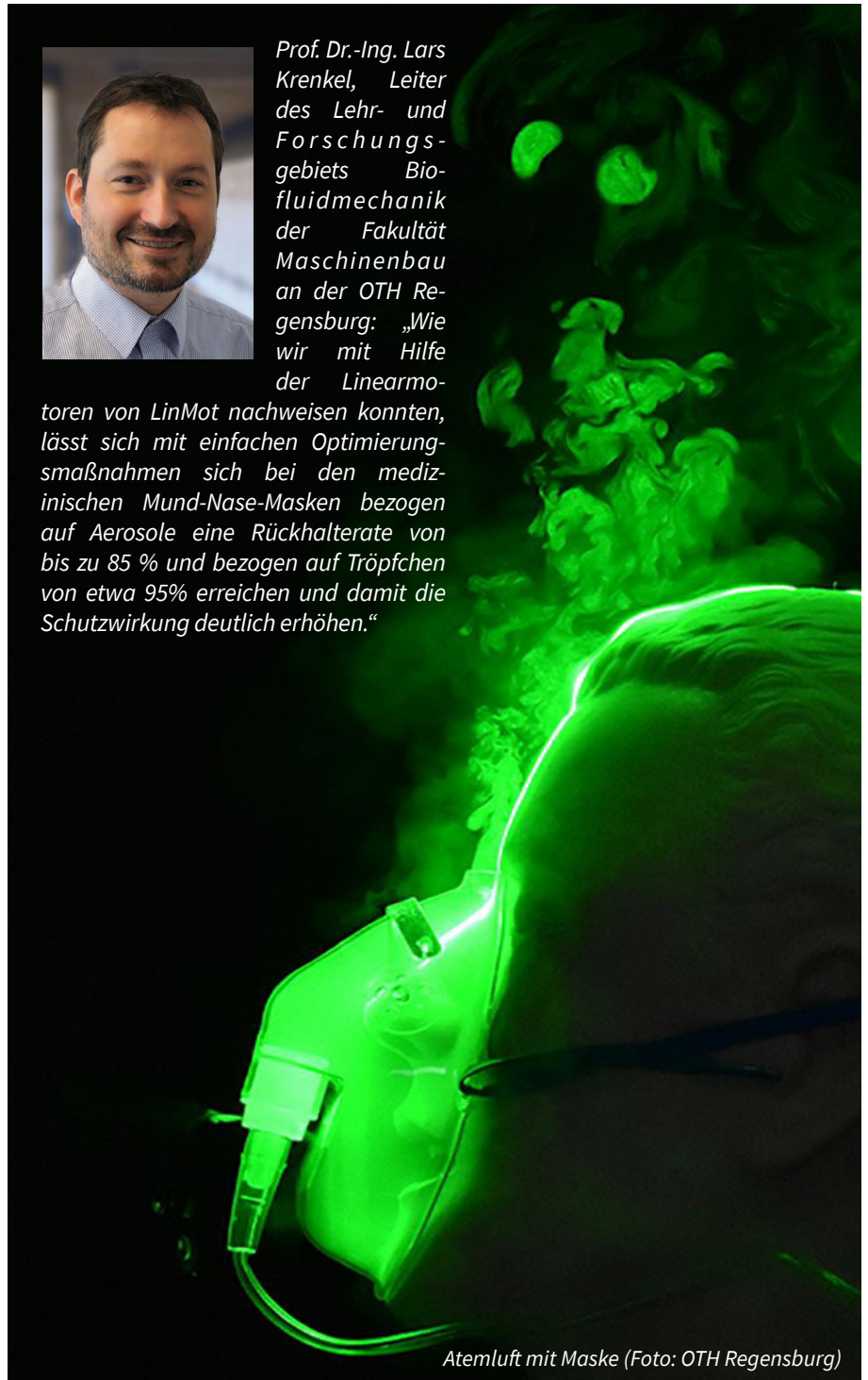
Atemluft mit Maske

lässt sich mit einfachen Optimierungsmaßnahmen sich bei den medizinischen Mund-Nase-Masken bezogen auf Aerosole eine Rückhalterate von bis zu 85 % und bezogen auf Tröpfchen von etwa 95% erreichen und damit die Schutzwirkung deutlich erhöhen.“