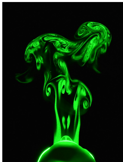
Atemluft ohne Maske

Das Licht bringt es an den Tag: Der aufgefächerte Laser macht im Labor von Prof. Dr.-Ing. Lars Krenkel den Rauch deutlich sichtbar, der unter den Rändern einer medizinischen Mund-Nase-Maske entweicht. Er besteht aus Partikeln von 200 nm bis 2 µm und eignet sich damit zur Modellierung der Aerosole, die von Menschen ausgeatmet werden. Besonders stark tritt der Rauch im Test oberhalb der Wangen und seitlich der Nasolabialfalten des verwendeten Dummies aus. Das legt nahe: Medizinisches Personal wie Rettungssanitäter oder Anästhesisten, die sich längere Zeit oberhalb oder unmittelbar neben dem Kopf eines erkrankten Patienten aufhalten, setzen sich dadurch der Gefahr einer Ansteckung aus, selbst wenn der Patient eine solche Maske trägt. „Einen 100%-Schutz können Masken grundsätzlich schon wegen möglicher Anwendungsfehler nicht bieten. Trotzdem wäre es falsch, ihnen eine Schutzwirkung komplett abzuspren-