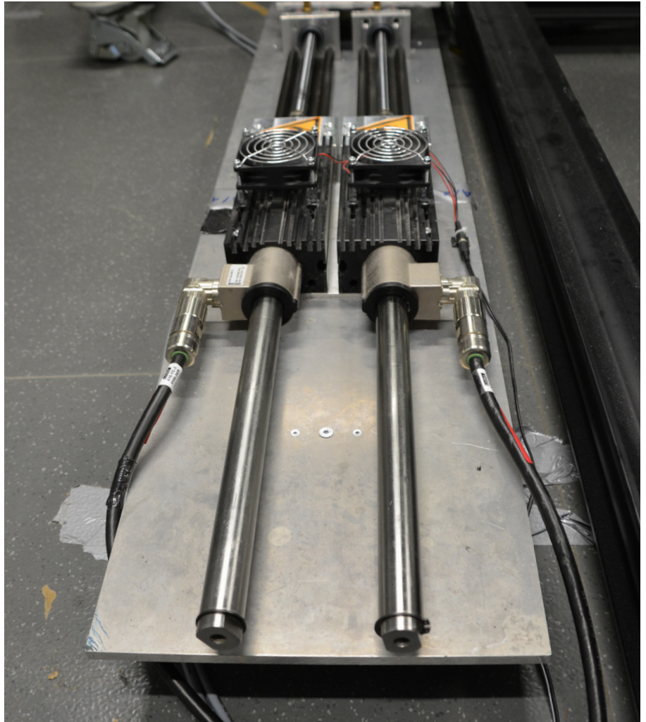
Flexibel und effizient einsetzbar: Linearmotoren von LinMot bilden die Basis für die Simulation von Atem- oder Blutströmungen..

Dank der Programmierbarkeit der Parameter „Beschleunigung“, „Verfahrgeschwindigkeit“ und „Hub“ konnten die Forscher verschiedene Atemszenarien wie normales Atmen, Husten oder hypoxisches Atmen mit geringem Aufwand implementieren. Dazu erstellten sie mit dem Engineering- und Konfigurationswerkzeug LinMot Talk verschiedene Bewegungsprofile. Die Forscher können diese Profile abspeichern und jederzeit direkt aus dem Steuerprogramm heraus abrufen - in beliebiger Reihenfolge und bei Bedarf gegebenenfalls auch während der Programmausführung über die Bedienerschnittstelle der Industrie-