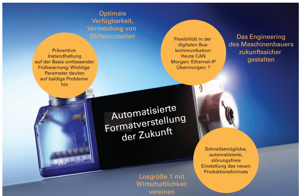
Abb. 2: Zukunftstrends der automatisierten Formatverstellung

Selbstverständlich werden dabei die klassischen Parameter überwacht: Temperaturen, Drehzahlen, Verfahrgeschwindigkeiten. Um wirklich präventiv warnen zu können, müssen